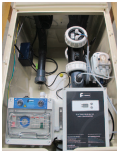
Schéma de principe d'un MX COE PH